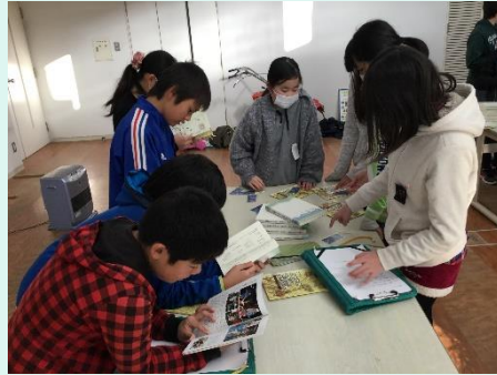
総合的な学習の時間<明野支所他>