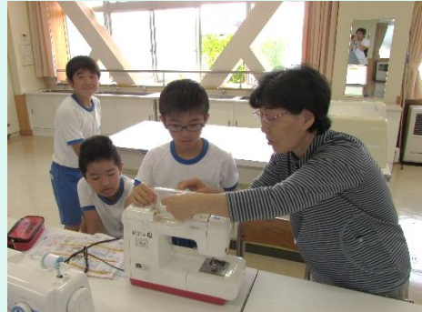
裁縫指導<地域のおばあちゃん>