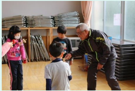
昔の遊び<1年生祖父母, 地域の方>