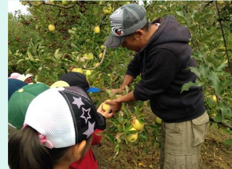
リンゴ狩り<新井りんご園さん>