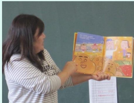
楽しい朝読書<ほんよみさん>