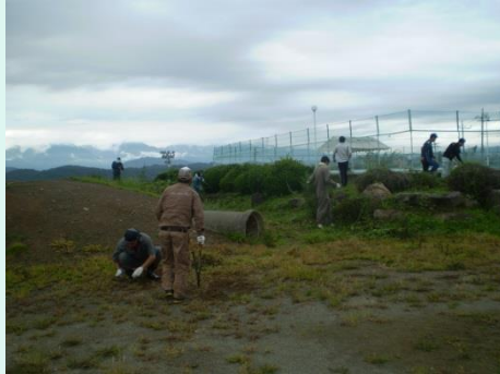
PTA環境整備作業 年間2回