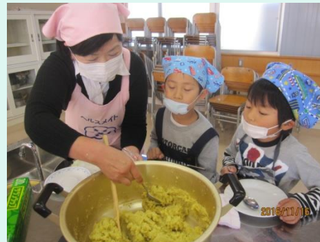
茶巾絞り<食生活改善推進員>