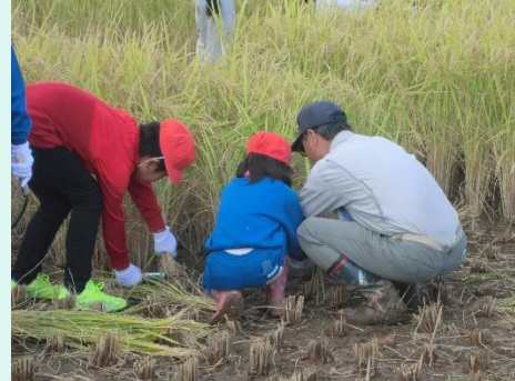
稲作支援<永井集落協同組合>